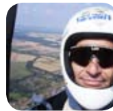
Foto-Austausch aus den Alpin-Höhen-Abschlusskursen und Reisen, etc. in der Flugschule